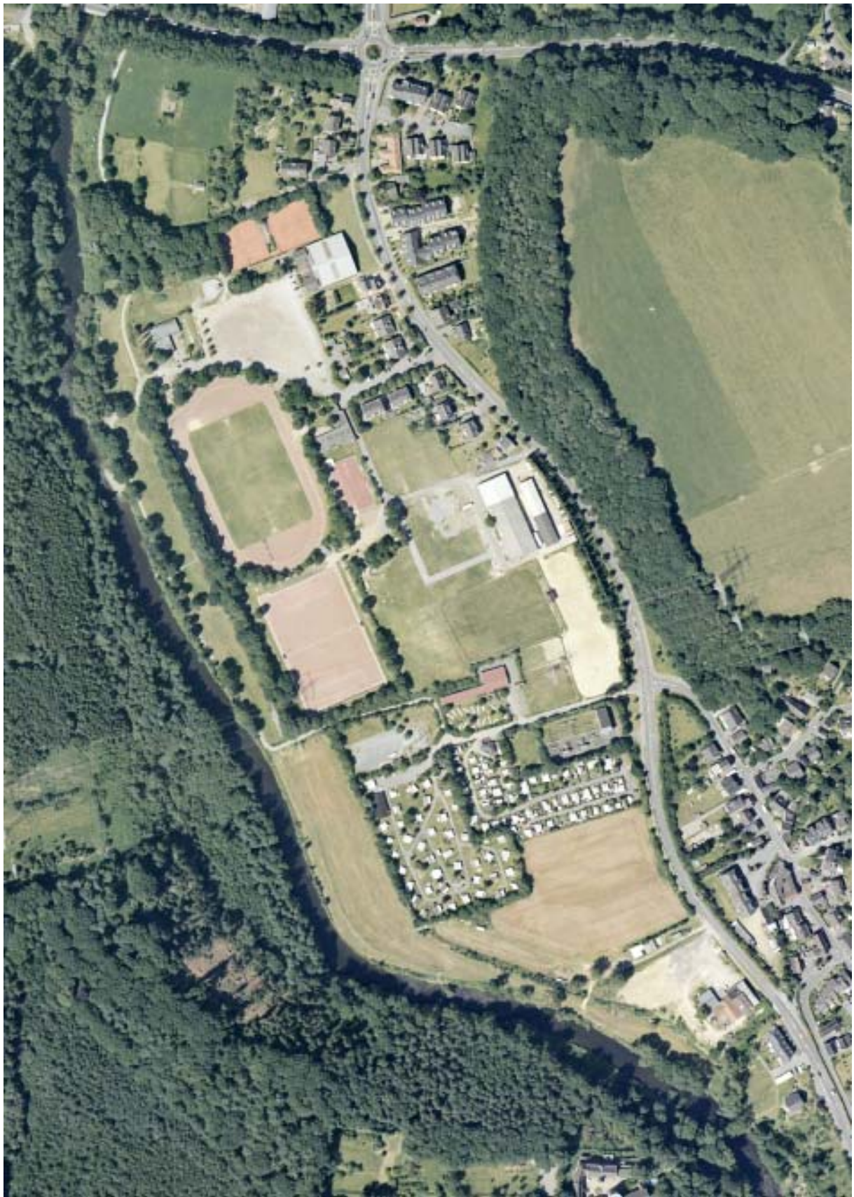
LUFTBILD BALKER AUE